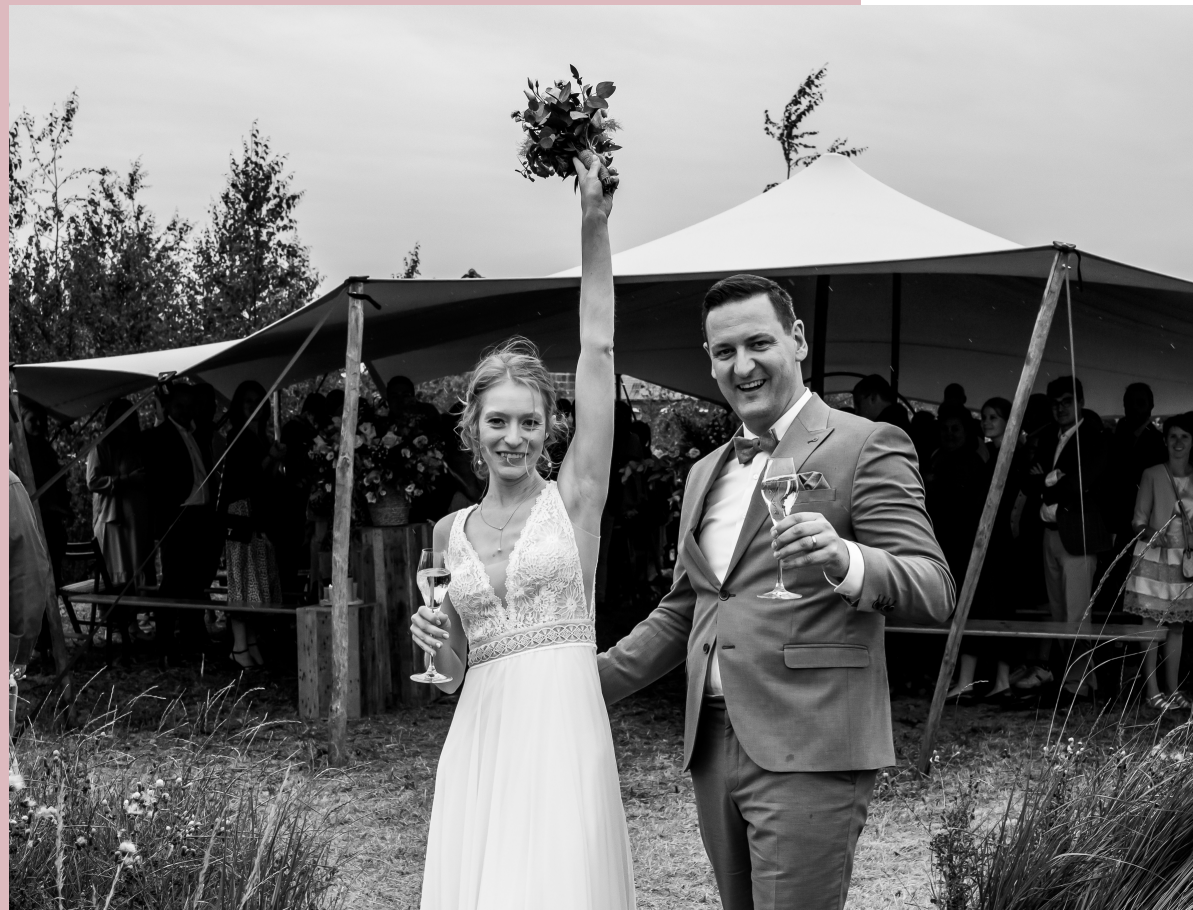
E ♥ Y [2023] - @ANDY HAUMAN

*Op zaterdag (ook indien dit een feestdag of een vooravond van een feestdag betreft) is het sacrament voorbehouden voor feesten vanaf minimum 100 personen (excl. kinderen t.e.m. 12 jaar). Raak je niet aan 100 personen? Geen probleem! Je kan het sacrament op zaterdag ook afhuren voor minder dan 100 personen. We rekenen dan wel de forfait aan voor 100 personen of een minimumbedrag voor de dranken en personeel indien je kiest voor stocktelling. Indien de zaal 6 maanden voor de gewenste datum nog niet is verhuurd, dan geldt het minimum van 100 personen niet.